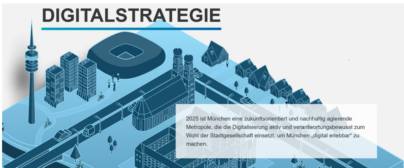
Abbildung 1 Digitalisierungsstrategie der Landeshauptstadt München

Die Digitalisierung der Landeshauptstadt München (LHM) trägt das Leitmotiv „München. Digital. Erleben.“ Mit der Digitalisierungsstrategie wurde eine Handlungsbasis geschaffen, die besonders die Bereiche Infrastruktur, Stadtverwaltung und Stadtgesellschaft fokussiert. Ziel ist es innovative, attraktive und am Gemeinwohl orientierte Angebote bereitzustellen und weiter auszubauen. Auf der Seite muenchen.digital erläutert das IT-Referat die Digitalisierungsstrategie der Landeshauptstadt München und informiert über Entwicklungen, Erfolge und Projekte rund um die Digitalisierung der Stadt.